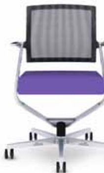
300.7000 + al310