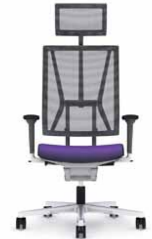
300.5000 + al301 + ns300