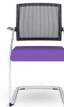
310.2500 + al310