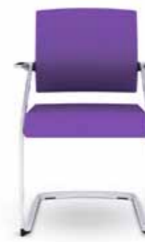
310.2000 + al310