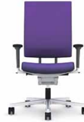
300.1000 + al301

Basic chair Fauteuil de travail De basisstoel