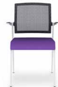
310.1500 + al310