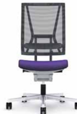
300.5000 + ls300