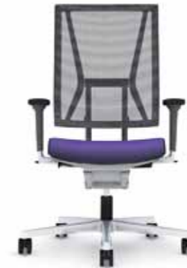
300.5000 + al301