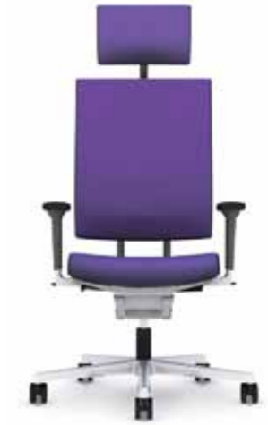
300.1000 + al301 + ns301

Executive chair Fauteuil direction De complete stoel