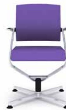
300.2000 + al310