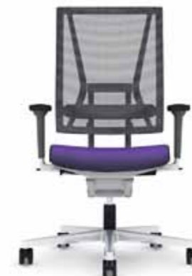
300.5000 + al301 + ls300