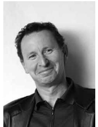
scope Productdesign Martin Ballendat