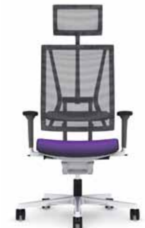
300.5000 + al301 + ns300 + ls300