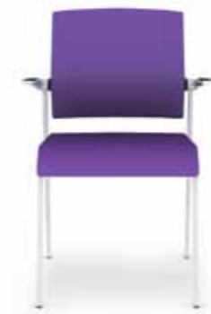
310.1000 + al310